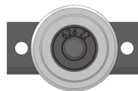
ROLDANA C/ ROLAMENTO